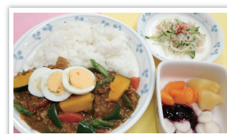
●夏野菜てんこ盛り